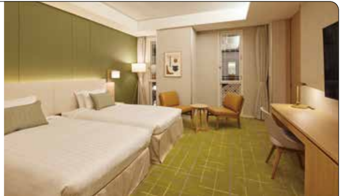
▲プレミアムコンフォートツイン