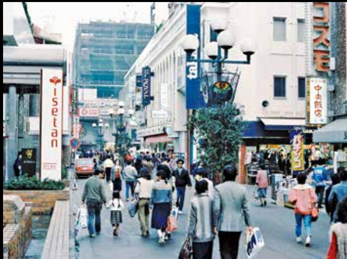
写真・昔この辺りは住宅街でしたが都市計画で元町通りが作られました。

あちこちのお店が目まぐるしく閉店開店している様子を見ると、商売の厳しさむずかしさがわかるような気がします。その上コロナ状況やウクライナ情勢も経営を圧迫していますが親しんだお店にはいつまでも居続けてもらいたいものです。