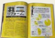
リフォームほんとうのトコロ