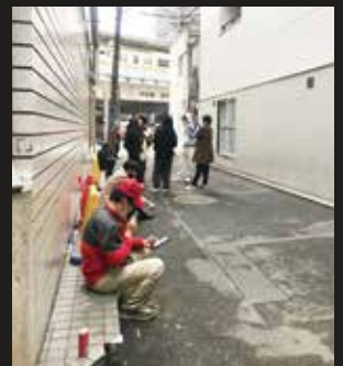
北口の路上喫煙現場。喫煙者のたまり場になっており、吸い殻がたくさん。吉祥寺に遊びに来た人だけでなく、近隣で働く人たちも多く利用しているようだ。

以前この路地にあった居酒屋が灰皿を独断で置いていたらしいが、現在はそれも撤去されている。しかし駅前再開発により、周囲の店やテナントが立ち退いたことで廃墟化し、路上禁煙地区からもギリギリ外れているため恰好の路上喫煙スペースになっているようだ。周囲のビルには「タバコのポイ捨てご遠慮ください！」「この階段の近くで喫煙しないでください。煙が建物の中に入りますため」との貼り紙があり、周辺の方