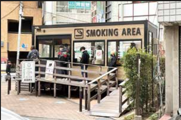
武蔵野市が設置した吉祥寺公園口の喫煙トレーラーハウス。6名の人数制限があるため、いつも入室待ちの列をなしている。