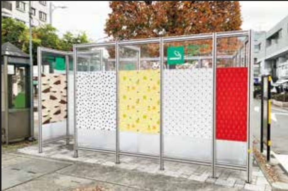
新小平駅前喫煙所。壁面のグラフィックは、ブルーベリー、梨、糰うどん、玉川上水などがモチーフになっている。